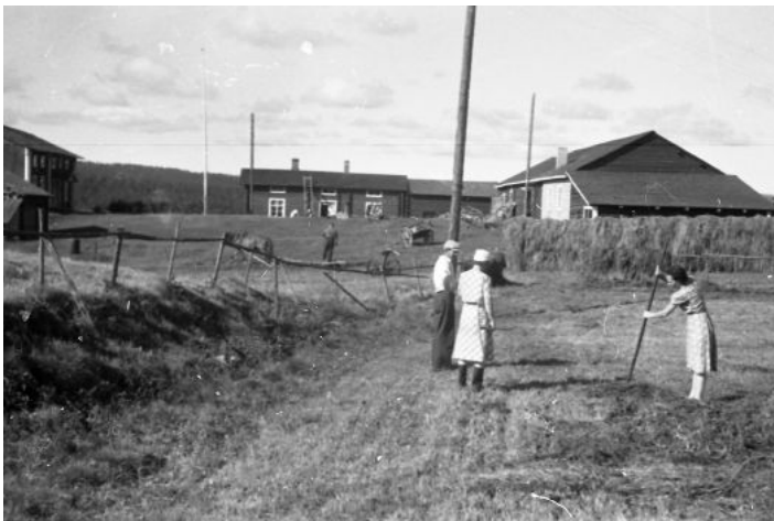
Slåtter vid Nygårds