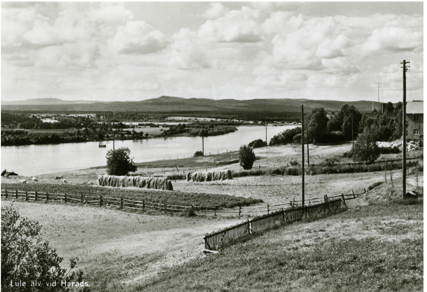
Lule älv vid Harads.